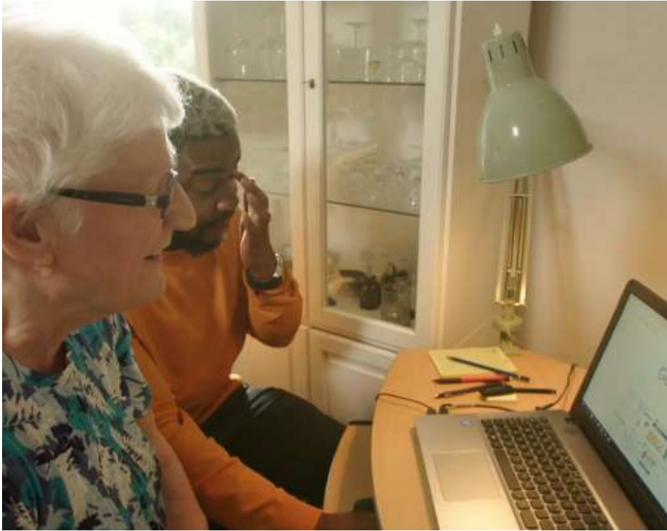
Seniorit somessa – tubettajat opastavat ikäihmisiä netin saloihin