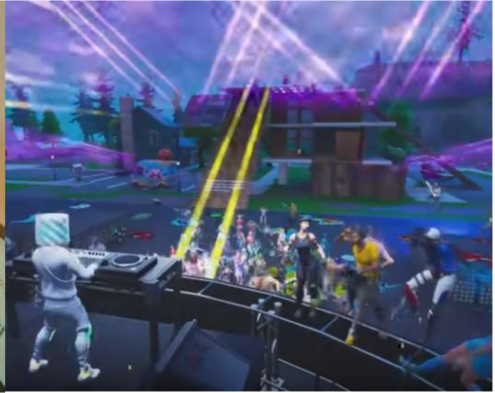
Marshmello Holds First Ever Fortnite Concert Live at Pleasant Park