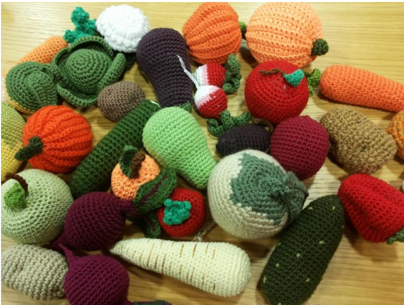
Tanja Rantanen 2014, CC BY 4.0