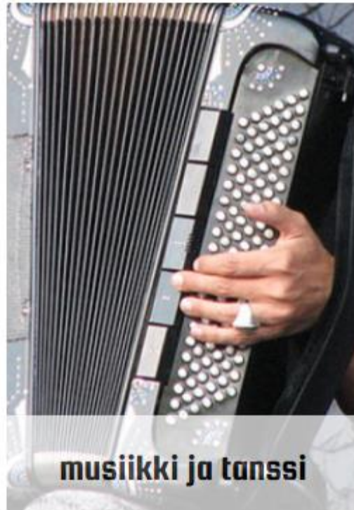
musiikki ja tanssi