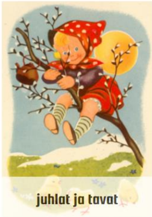
juhlat ja tavat